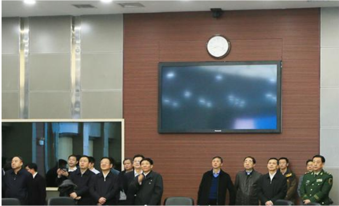
2016 年全国林业厅局长会议现场会上，张建龙局长在省委副书记孙金龙陪同下与各省代表一起观看信息化系统演示