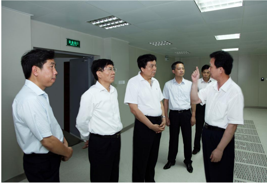
国家林业局赵树丛局长在湖南省委副书记孙金龙、省人民政府副省长张硕辅的陪同下亲临林业数据中心现场视察指导

年湖南省政府部门网站绩效评估中排名第四，获得“湖南省优秀政府网站”称号，同时，被国家林业局评为“全国林业十佳网站”。湖南林业信息网“测土配方”栏目荣获了国家电子政务理事会颁发的“2013年政府网站网上办事精品栏目奖”。