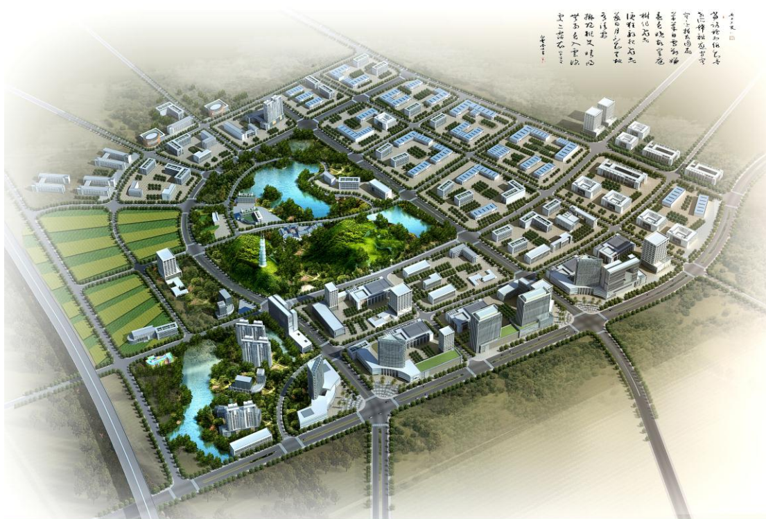
湖南省农林工业勘察设计研究院

龙头企业总量继续增加，带动能力进一步增强 2013 年，修订了《湖南省林业产业龙头企业认定管理办法》，提高了省级龙头企业认定标准，新认定省级林业产业龙头企业 60 家。同时，加强龙头企业运行监测，淘汰运行不达标企业，取消了 25 家企业省级龙头资格。全省现有省级林业产业龙头企业 356 家，龙头企业产值达 417 亿元，占二产业产值的 45%。其中产值过 10 亿元林业企业有 21 家，产值过亿元林业企业达 110 家。通过“企业+基地+农户”的方式，龙头企业基地建设明显增加，建设规模已达 76.4 万公顷，为产业可持续发展增添了后劲，夯实了基础。